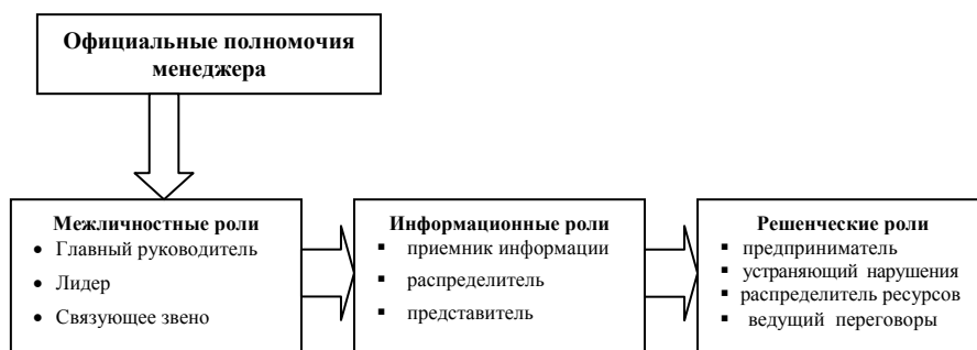
Рис. 2.2. Управленческие роли менеджера

Все роли можно объединить в три группы (см. рис. 2.2).